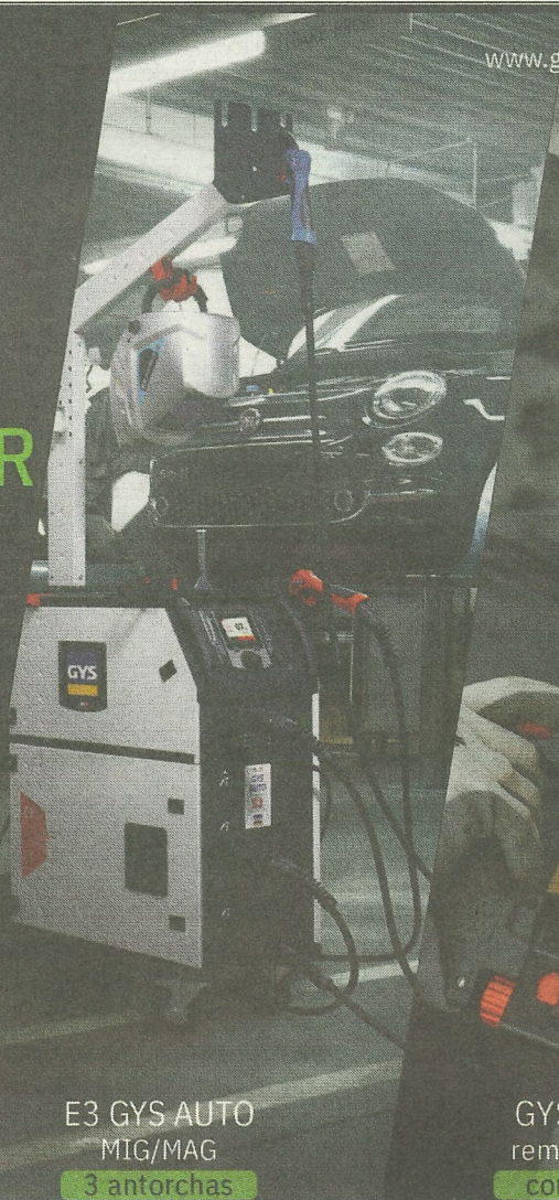
E3 GYS AUTO MIG/MAG 3 antorchas