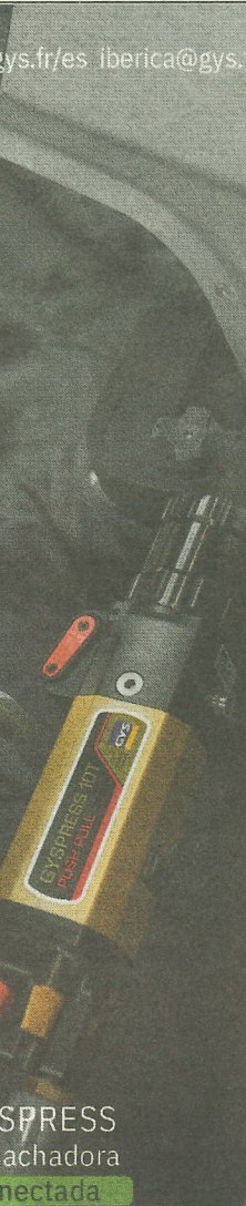
GYS PRESS remachadora conectada