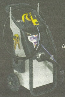
GYS DUST Extractor Aspirador neumático para el polvo ATEX categoría 3

Tenemos la solución más completa para tu taller